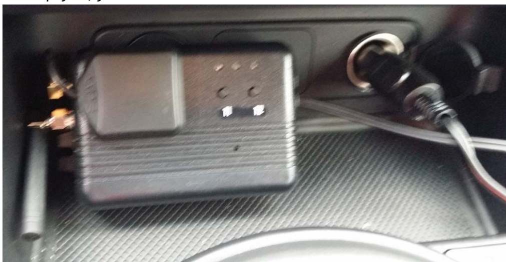
Pokud přejde jednotka do stavu jízdy (změna GPS a akcelometru) je toto opticky signalizováno rozsvícením zelené LED: